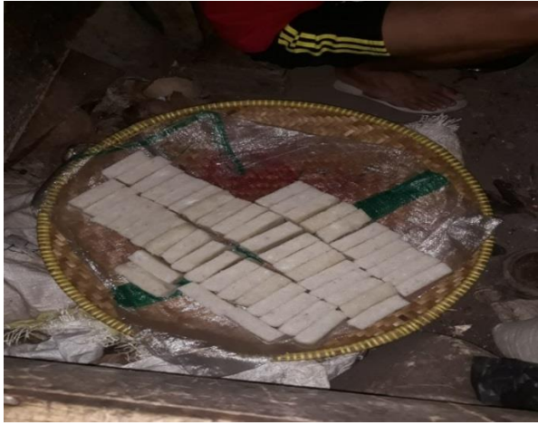
Gambar 1. Persiapan Pembakaran