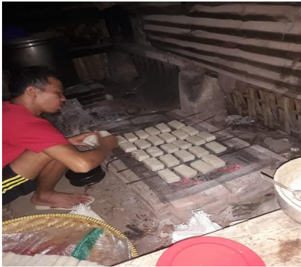
Gambar 2. Proses Pembakaran