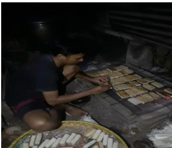
Gambar 3. Proses Membolak Balikkan Ketan