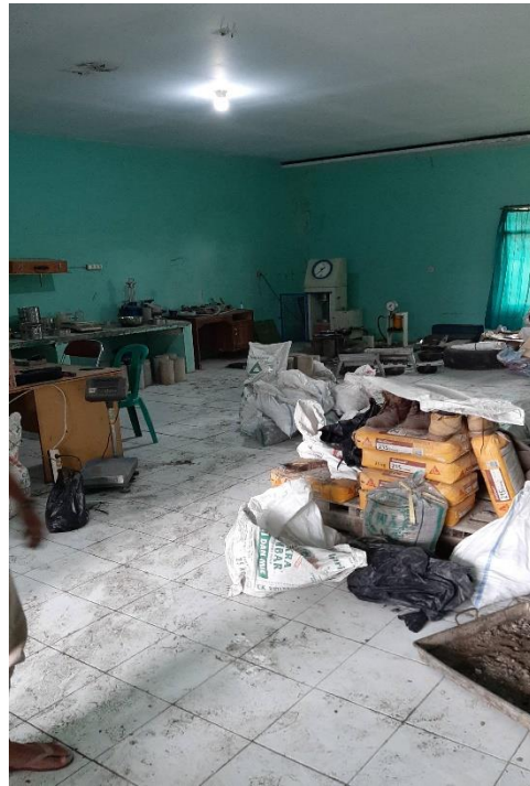
Gambar 3. 3 Ruangan dalam lab