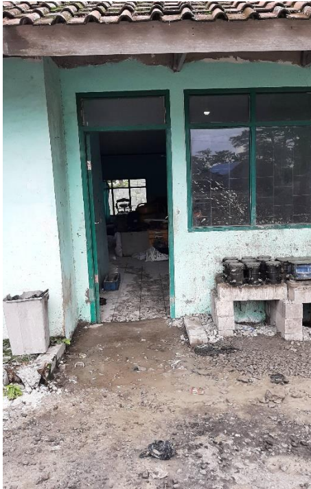
Gambar 3. 2 Ruangan lab TMPP