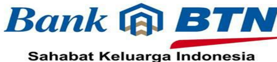
Gambar 3.2 Logo Perusahaan