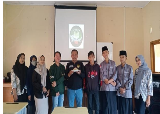
Kegiatan persentasi hasil kerja kelompok warga belajar program paket C