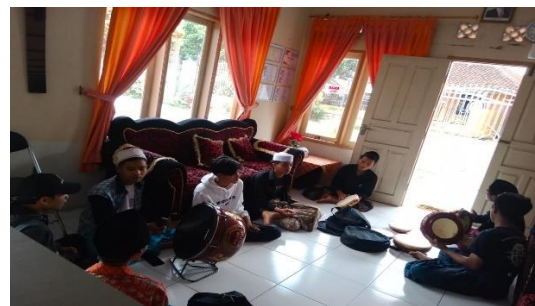
Kegiatan Latihan ekstrakurikuler hadroh warga belajar program paket C