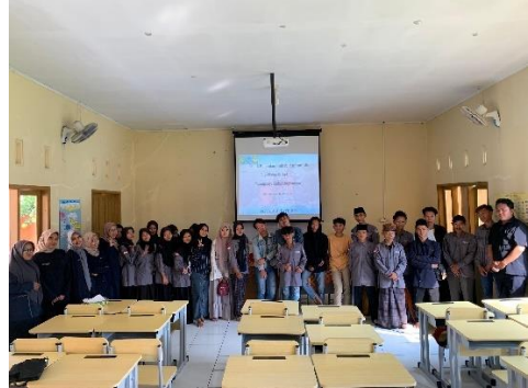
Kegiatan pembelajaran warga belajar program paket C