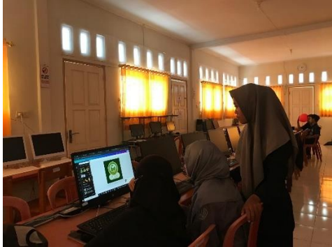
Kegiatan pembelajaran computer warga belajar paket C