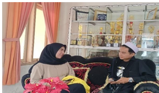
Wawancara bersama warga belajar program paket C