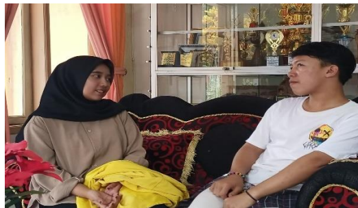
Wawancara bersama warga belajar paket C