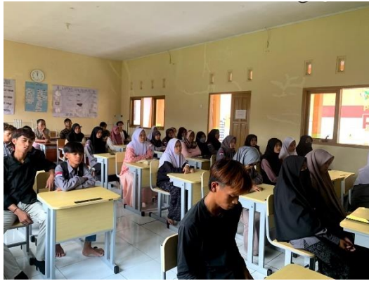
Kegiatan pembelajaran program paket C di PKBM Al Fattah