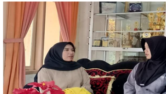
Wawancara bersama warga belajar program paket C