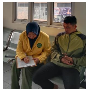
Wawancara dengan responden