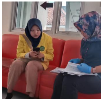
Pengenalan diri dengan petugas