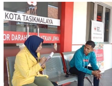
Wawancara dengan responden