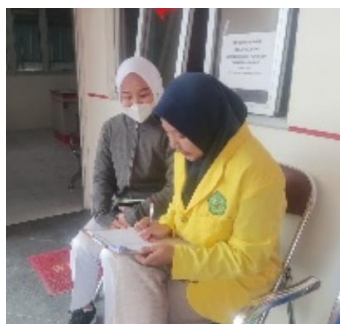
Wawancara dengan responden