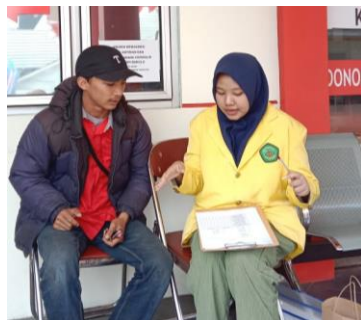
Wawancara dengan responden