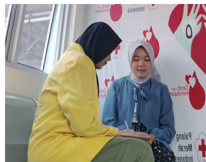
Wawancara dengan responden