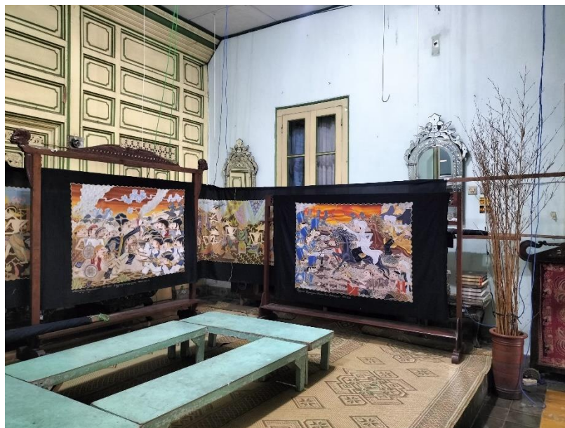
Gambar 16. Pajangan Batik Tulis di Batik Mahkota Laweyan