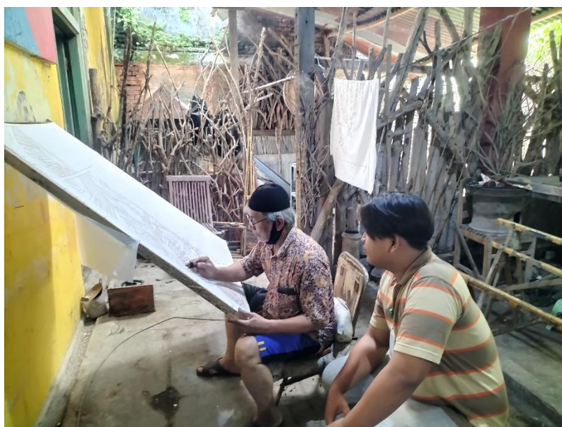
Gambar 17. Peneliti sedang memperhatikan seorang pembatik yang menggoreskan lilin pada kain putih lokasi berada di Rumah Batik Mahkota Laweyan (Sumber : Dokumen Pribadi)