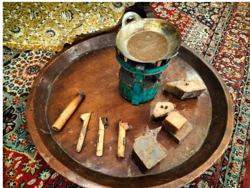
Gambar 19. Peralatan membatik, Cantik, Malam, Wajan dan Kompor