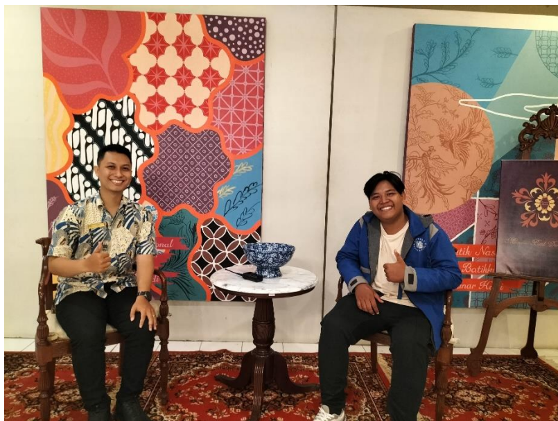
Gambar 13. Peneliti melakukan foto Bersama dengan salah satu Guide PT. Batik Danarhadi di kesenian Museum Danarhadi Surakarta