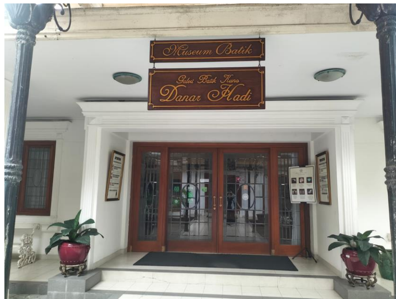
Gambar 15. Museum Danarhadi di Surakarta