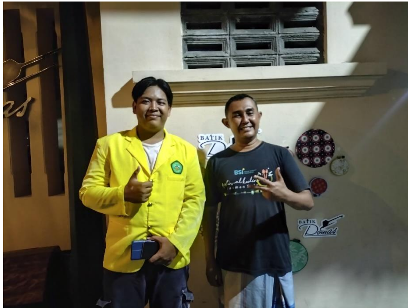
Gambar 12. Peneliti melakukan foto bersama dengan Kepala KSU Syarikat Dagang Kauman & Pematik