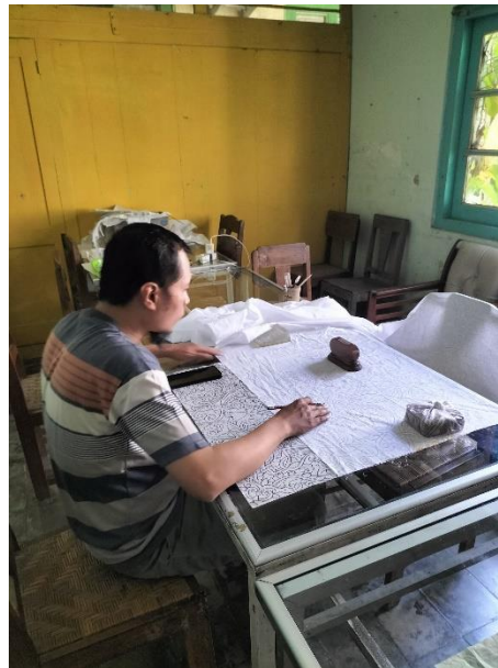
Gambar 18. Pembatik sedang menggambar pola motif batik pada kain putih, di Kampung Batik Laweyan