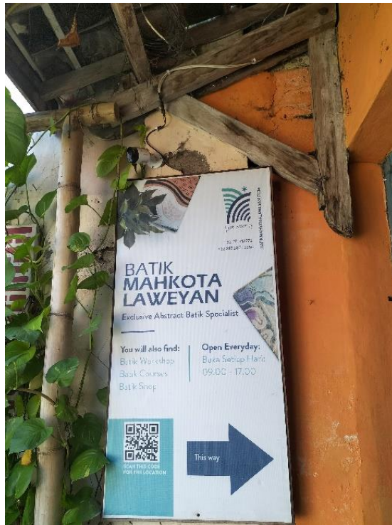
Gambar 14. Plang Galeri Batik Mahkota Laweyan Surakarta