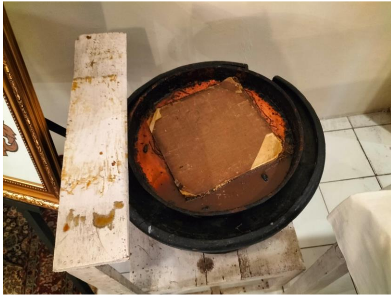
Gambar 20. Tempat pencelupan Batik yang ingin di berikan warna.