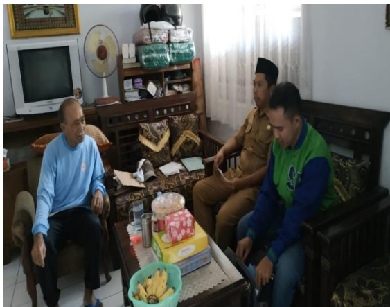
Keterangan gambar: Kegiatan Wawancara