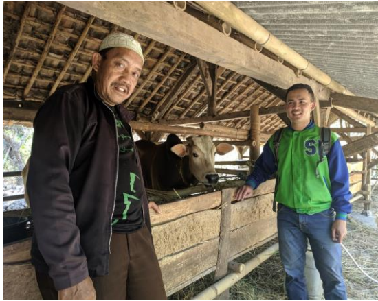
Keterangan gambar: Peninjauan sapi bersama responden