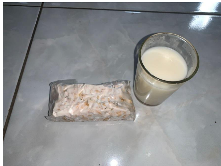
Protein (Tempe & Susu)