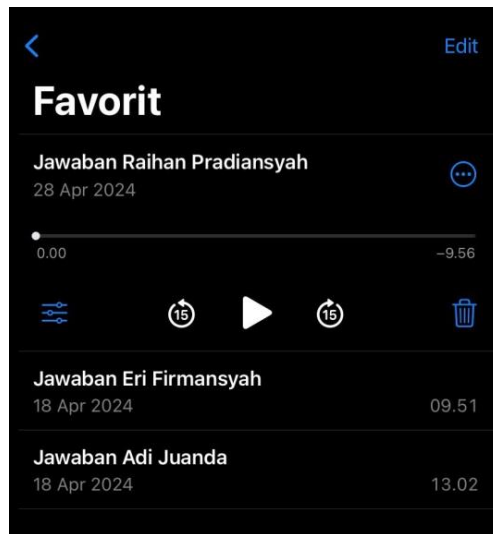
Rekaman Hasil Wawancara