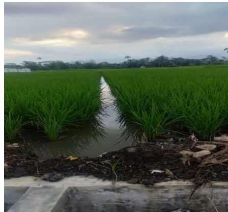
Lokasi Usahatani Minapadi