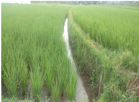
Lokasi Usahatani Minapadi