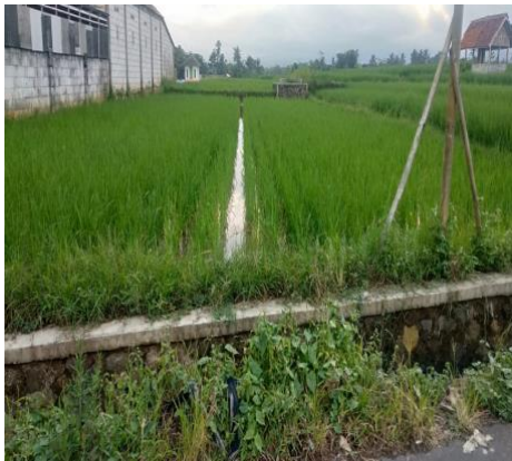
Lokasi Usahatani Minapadi