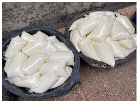
Susu Sapi Segar