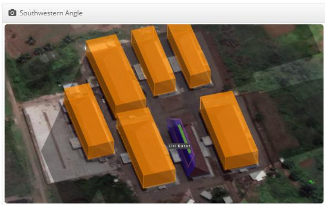
Pemodelan PLTS 15,4 kWp Array Atap Barat