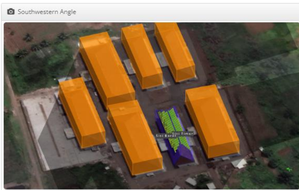
Pemodelan PLTS 148,5 kWp