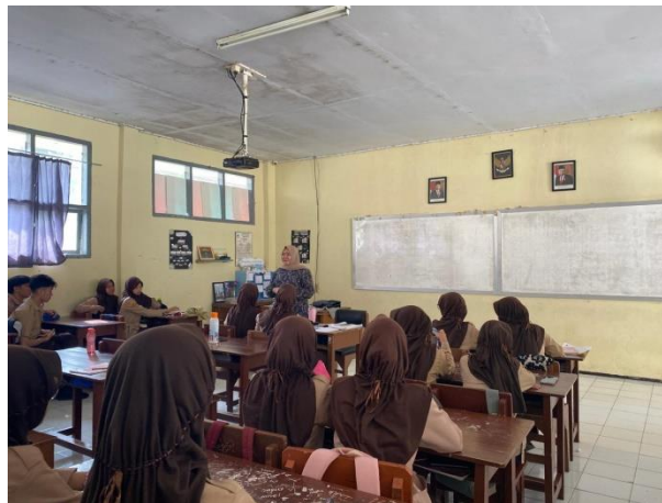
Tahap Pendahuluan Guru memaparkan teknis pembelajaran menggunakan media Tiktok