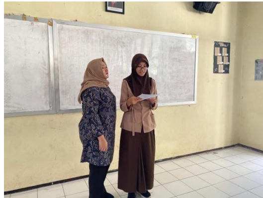
Tahap Pemaparan Peserta didik memaparkan hasil jawaban yang telah didiskusikan