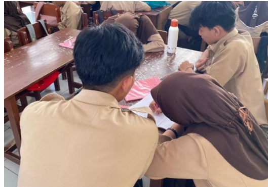
Tahap Mengerjakan LKPD Setelah menonton video di Tiktok, peserta didik menjawab pertanyaan