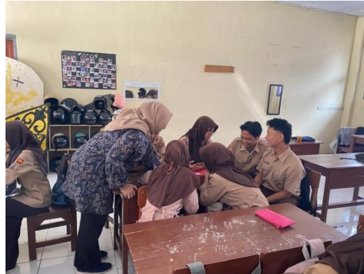
Tahap Pembelajaran Kelompok Menggunakan Media Video Tiktok Peserta didik secara bersama-sama menonton video yang ada di Tiktok