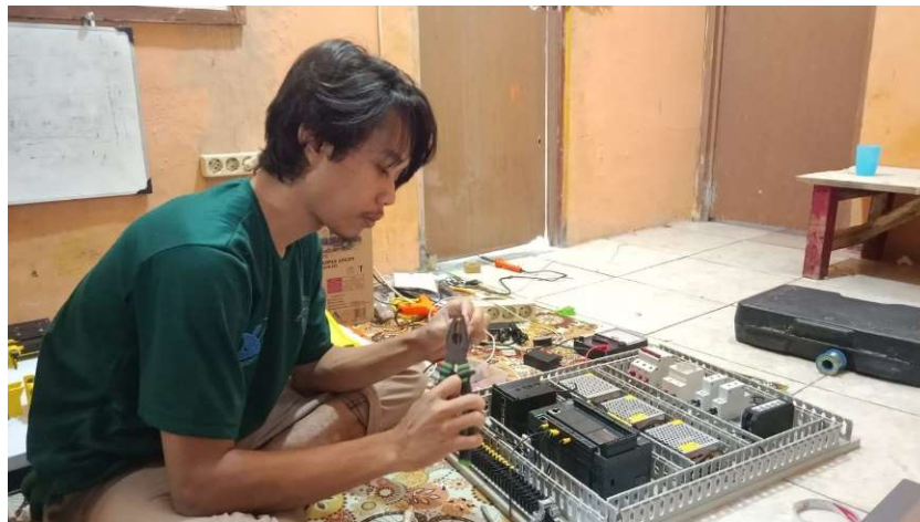
Gambar 11 Dokumentasi Wiring Komponen Kontrol