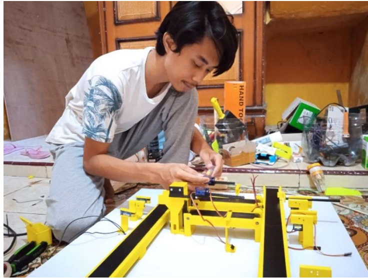
Gambar 12 Dokumentasi Perakitan Sistem pada Papan Triplek