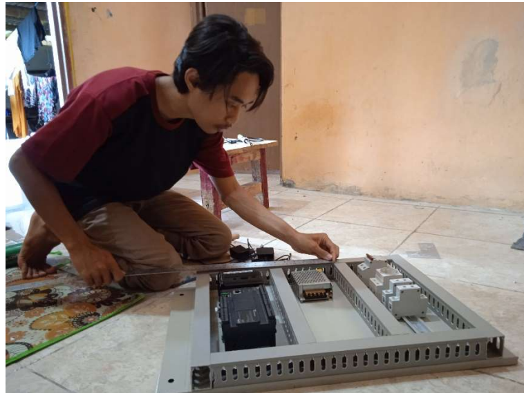
Gambar 10 Dokumentasi Perakitan Komponen Kontrol