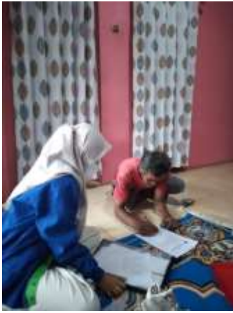
a. Pengisian kuisioner oleh responden