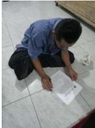
b. Pengisian kuisioner oleh responden