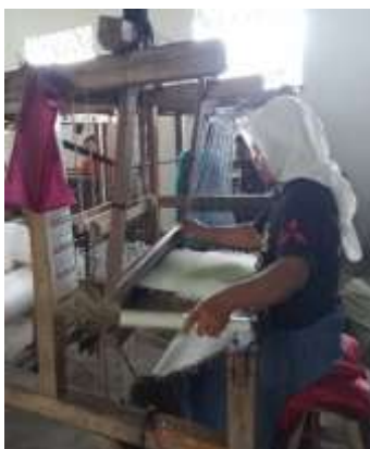
g. Kegiatan penenunan