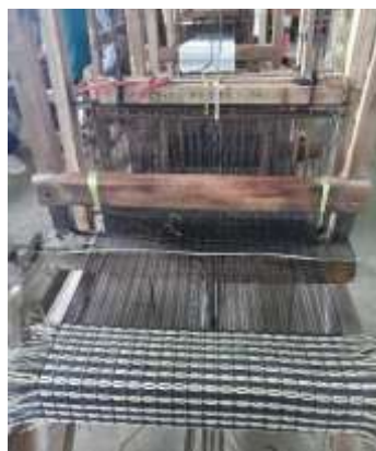
i. Proses Pembuatan Tikar