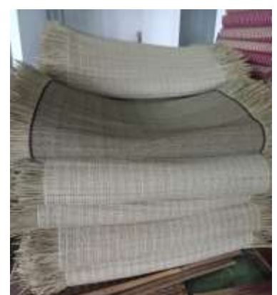
h. Proses Pembuatan Tikar