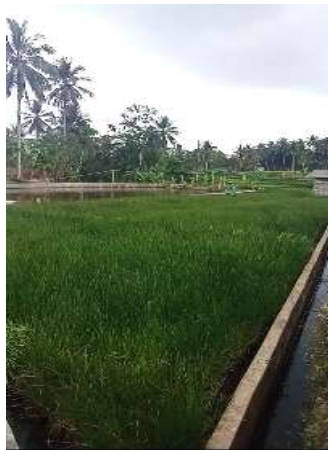
d. Kondisi lahan mendong