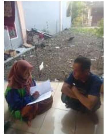
c. Pengisian kuisioner oleh responden