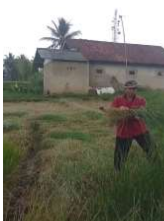
e. Kegiatan pemanenan mendong