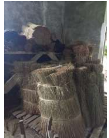
f. Mendong yang sudah dikeringkan