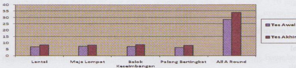
Grafik 2. Perkembangan hasil latihan olahragawan senam putri

Pengujian normalitas tes ini menggunakan tes kecocokan chi-kuadrat . Hasil pengujian akan menentukan pendekatan mana yang akan dipergunakan dalam analisis data, apakah pendekatan parametrik atau non-parametrik. Pendekatan parametrik digunakan apabila hasil pengujian tes tersebut ternyata normal. Sedangkan pendekatan non-parametrik digunakan apabila hasil pengujian tes tersebut ternyata tidak normal. Setelah dihitung diperoleh hasil sebagaimana dalam Tabel 2 di bawah ini.