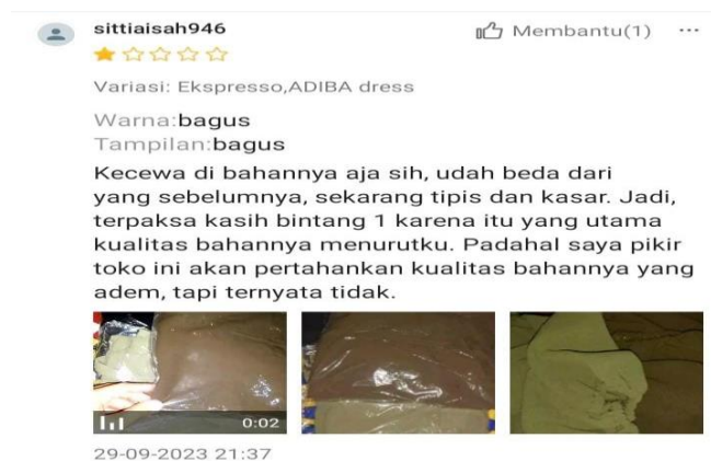
Gambar 1. 6