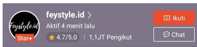
Gambar 1. 3

Shopee (feystyle.id) dengan jumlah pengikut 1,1JT