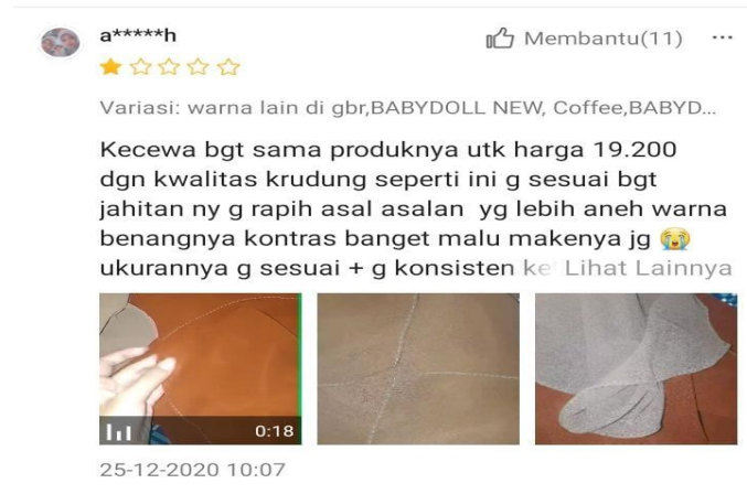
Gambar 1. 5

konsumen dari Marketplace Shopee menyatakan bahwa kualitas produk Feystyle.id yang kurang baik.