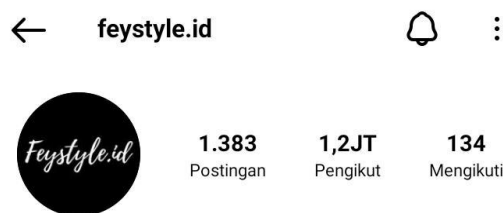
Gambar 1. 2

Instagram (feystyle.id) dengan jumlah pengikut 1,2 JT