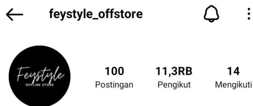
Gambar 1. 1

Instagram Offline store (Feystyle_offstore) dengan jumlah pengikut 11,3 RB