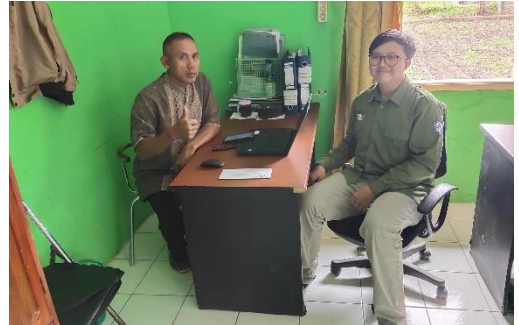
Kegiatan Wawancara dengan Informan dari Pemerintahan Desa Ciganjeng