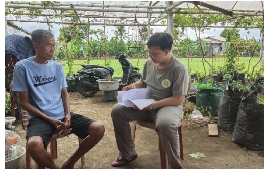
Kegiatan Wawancara dengan Informan Agrowisata Anggur Desa Ciganjeng