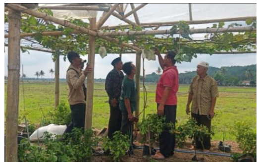
Pengunjung berkeliling kebun anggur ditemani oleh pemilik