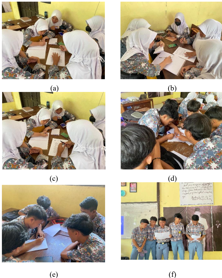
(a) Objective Finding (b) Fact Finding (c) Problem Finding (d) Idea Finding (e) Solution Finding (f) Acceptance Finding