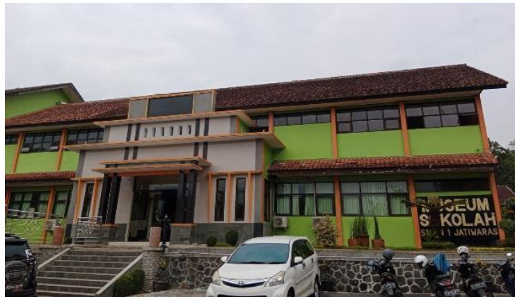
Gambar 3.9 Lokasi penelitian SMAN 1 Jatiwaras