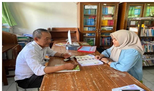
Gambar 3.1 Konsultasi dengan Guru Mata Pelajaran Biologi