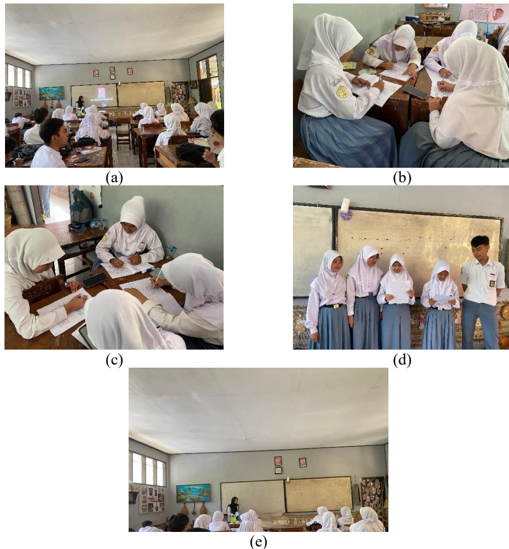
Gambar 3.6 Kegiatan Inti Pembelajaran Pertemuan Ke dua (a) Mengorientasi (b) Mengorganisasi (c) Membimbing (d) menyajikan hasil (e) Analisis dan evaluasi