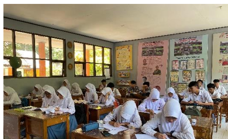
(a) (b) Gambar 3.3 Kegiatan Pendahuluan Kelas Kontrol dan Eksperimen (a) Pelaksanaan Pretest di Kelas Eksperimen (b) Pelaksanaan Pretest di Kelas Kontrol