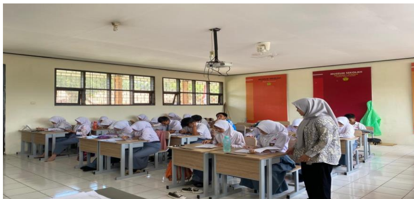
Gambar 3.2 Uji Instrumen di Kelas XII MIPA 2 SMAN 1 Jatiwaras