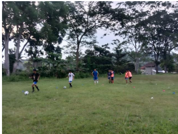
Gambar 3.3 Tes Menggiring Bola