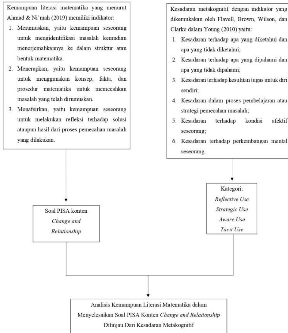
Gambar 2. Kerangka Teoretis

penelitian ini, peneliti melakukan analisis kemampuan literasi matematika dalam menyelesaikan soal PISA pada konten change and relationship ditinjau dari kesadaran metakognitif.