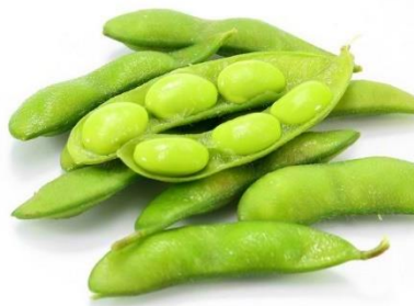
Gambar 1 Kedelai Edamame

Biji edamame berukuran lebih besar daripada kedelai biasa dan bertekstur halus. Selain itu, kadar protein, serat dan gula yang terdapat pada kedelai ini memiliki jumlah yang lebih tinggi daripada kedelai lainnya. Sehingga tidak heran jika edamame ini memiliki rasa yang manis dan digunakan sebagai salah satu makanan favorit untuk diet karena mudah diserap (Muaris, 2013). Wayan et al. (2019) melaporkan bahwa susu kedelai merupakan produk bebas laktosa dengan kandungan lemak yang lebih rendah (2,5 g/100 g), sehingga susu edamame baik digunakan untuk camilan diet rendah lemak. Bentuk polong dan biji kedelai edamame dapat dilihat pada Gambar 1.