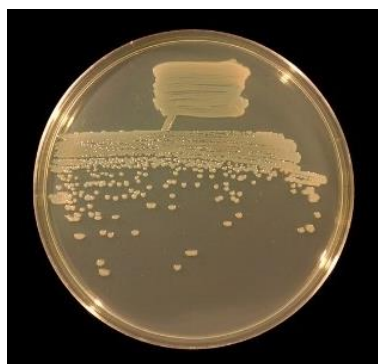
Gambar 3 Pseudomonas fluorescens

Pseudomonas fluorescens merupakan kelompok bakteri aerob yang menggunakan oksigen untuk menerima elektron. Nitrat juga biasa dimanfaatkan beberapa spesies bakteri untuk menerima elektron dalam respirasi anaerobik, sebab nitrat mampu tumbuh secara anaerobik. Bakteri ini memiliki bentuk batang lurus lengkung, ukurannya 0,5 sampai 0,1 x 1,5 sampai 4,0 m, bereaksi negatif terhadap pewarnaan Gram (Hasanuddin, 2003) Pseudomonas sp memiliki kemampuan tumbuh pada kisaran suhu 35° sampai 37°C, suhu optimal 25°C sampai 30°C, suhu minimum 4°C dan suhu maksimum 41°C. Bentuk bakteri Pseudomonas fluorescens dapat dilihat pada Gambar 3.