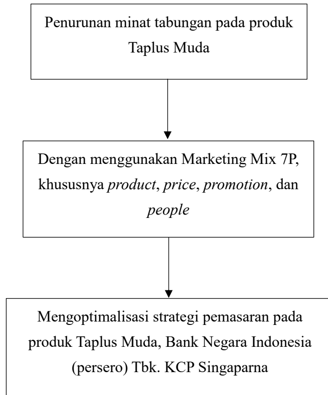
Gambar 2.3 Skema Pendekatan Masalah