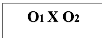
Gambar 3.1 Model Eksperimen One Group Pretest-Posttest Design

Heryadi (2014) mengemukakan, “Desain penelitian merupakan rancangan pola atau corak penelitian yang dilakukan berdasarkan kerangka pikir yang dibangun”(hlm. 123). Dalam suatu penelitian eksperimen perlu dipilih satu desain yang tepat sesuai dengan kebutuhan variabel-variabel yang terkandung dalam tujuan penelitian dan hipotesis yang digunakan. Desain penelitian yang digunakan dalam penelitian ini adalah “ The One Group Pre-Test Post-Test ” seperti yang digunakan pada desain berikut ini.