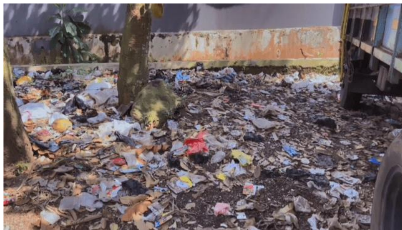
Gambar 2.4 Pencemaran Tanah oleh Sampah Organik dan Anorganik Sumber: Data Pribadi

Danhas 2018:88). Komposisi tanah tergantung kepada proses pembentukannya, pada iklim, pada jenis tumbuhan yang ada, suhu, dan pada air yang ada di sana. Pencemaran menyebabkan tanah mengalami perubahan susunannya, sehingga mengganggu kehidupan jasad yang hidup di dalam tanah maupun di permukaan. Pencemaran tanah dapat terjadi karena pencemaran secara langsung, misalnya penggunaan pupuk secara berlebihan, pemberian pestisida atau insektisida dan pembuangan limbah yang tidak dapat dicernakan seperti plastik (Utina dan Baderan 2015).