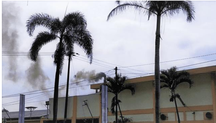
Gambar 2.2 Pencemaran Udara dari Pabrik

dari kegiatan industri serta pemakaian zat-zat kimia yang disemprotkan ke udara (Utina dan Baderan 2015).