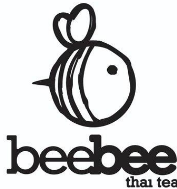
Gambar 3.1 Logo Perusahaan

Beebee Thaitea Tasikmalaya didirikan pada awal tahun 2020 dan merupakan sebuah perusahaan minuman kekinian yang ada di kota tasikmalaya, semenjak awal di dirikan beebee thaitea sangat menjunjung tinggi profesionalisme dalam berusaha minuman agar menjadi nomer satu di hati masyarakat. Hal tersebut selaras dengan visi perusahaan yaitu “Menjadi role model minuman kekinian di indonesia”. Maka dari itu perusahaan sangat berusaha keras untuk mewujudkan visi perusahaan tersebut menjadi sebuah harapan bagi perusahaan. Saat ini Beebee thaitea memiliki 10 cabang yang tersebar di berbagai daerah di kota tasikmalaya, jadi tidak heran di awal kemunculan nya menjadi minuman pilihan bagi warga