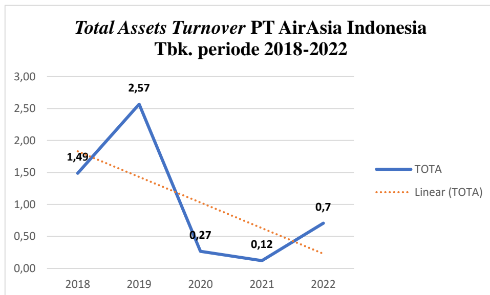
Gambar 1. 3

Berikut adalah gambaran Total Assets Turnover PT AirAsia Indonesia Tbk periode 2018-2022: