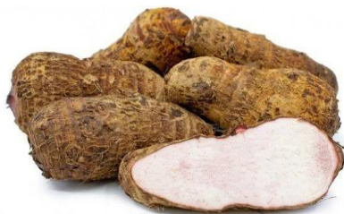
Gambar 2. 1 Umbi Talas (Astuti, 2021)

Karakteristik fisik talas yaitu umbinya berbentuk lonjong sampai agak membulat. Kulit talas berwarna kemerah-merahan dengan kulit yang kasar karena terdapat bekas-bekas pertumbuhan akar. Warna daging talas yaitu putih keruh (Anggraini, 2012). Umbi talas dapat dilihat pada Gambar 2.1.