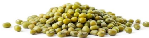
Gambar 2. 2 Kacang Hijau (Kangsaputra, 2021)

Kacang hijau memiliki keunggulan diantaranya yaitu kadar protein tinggi sebanyak 22,9 g/100g (Tabel 2.5). Protein yang tinggi pada kacang hijau sangat bermanfaat untuk masa pertumbuhan remaja karena berfungsi sebagai sumber energi, zat pembangun dan pengatur (Putri et al. , 2022). Lemak dalam kacang hijau tergolong cukup rendah yaitu 1,5 g/100g sehingga baik dikonsumsi oleh remaja dengan kategori gizi berlebih (Septiani et al. , 2022). Kandungan mineral pada kacang hijau juga tinggi terutama kalsium 223 mg/100 g, kalsium 815,7 mg/100 g dan fosfor 319 mg/100g (Tabel 2.5). Mineral berfungsi untuk pertumbuhan, pengaturan, dan perbaikan fungsi tubuh (Almatsier & Sunita, 2011). Kacang hijau juga memiliki kadar serat tinggi 7,5 g/100g sehingga sangat baik untuk menjaga saluran pencernaan dan dapat menunda pengosongan lambung sehingga tidak cepat merasa lapar (Tabel 2.5) (Zaki et al. , 2022).