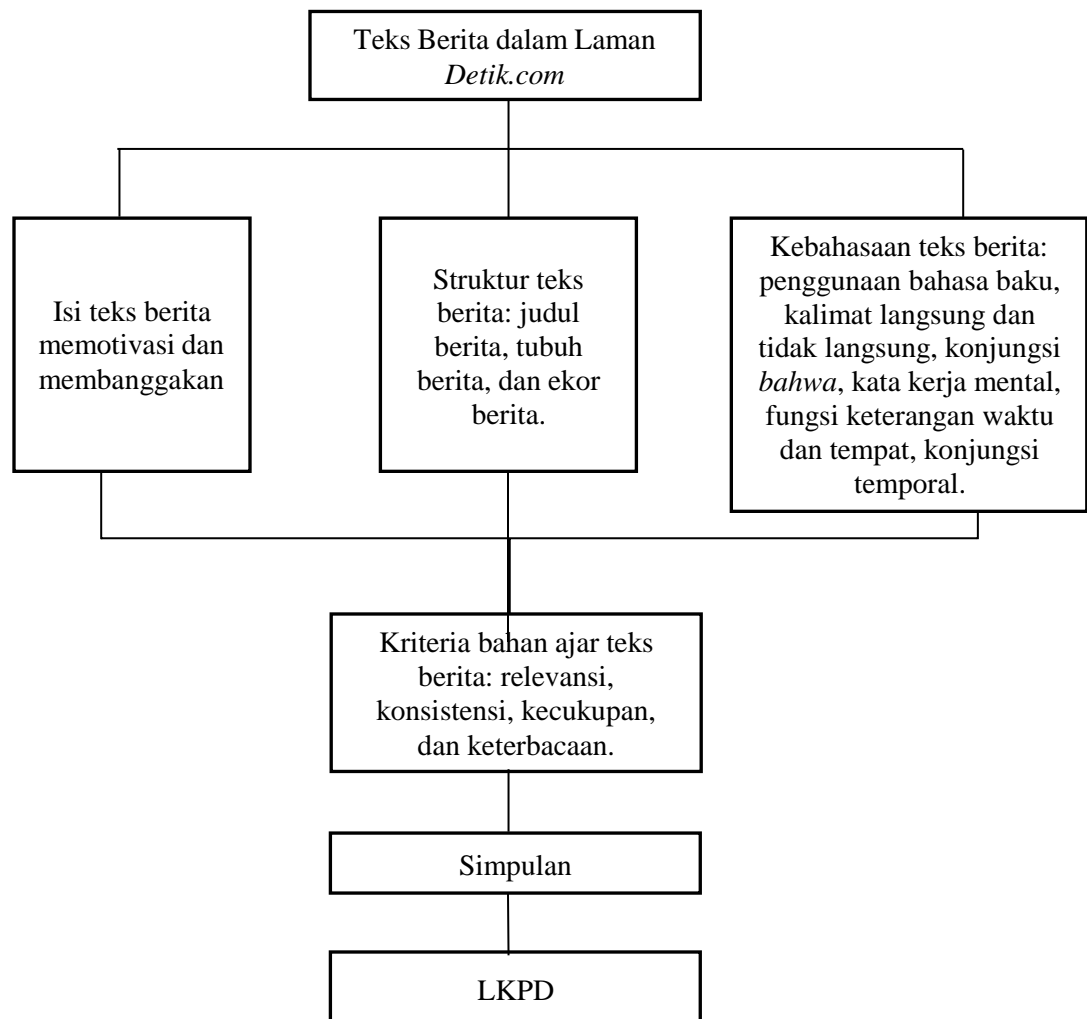
Tabel 3. 1 Desain penelitian Analisis Struktur Teks Berita dalam Laman Detik.com sebagai Alternatif Bahan Ajar

Desain penelitian yang akan penulis gunakan sebagai berikut.