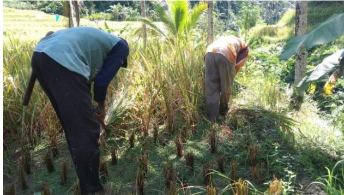
Gambar 2. 2 Nilai Kerja Sama