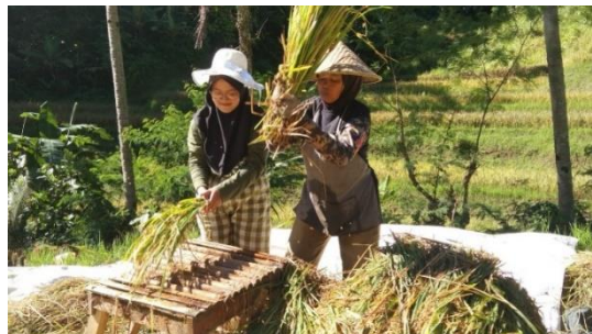
Gambar 2. 1 Nilai Kerja Keras