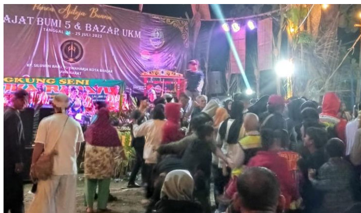
Gambar 2. 6 Nilai Kebersamaan