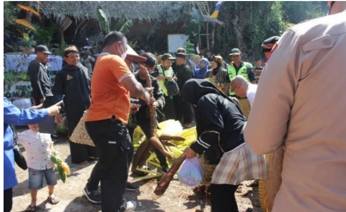
Gambar 2. 5 Nilai Toleransi