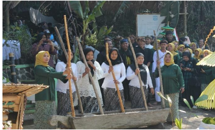
Gambar 2. 7