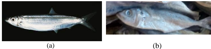
(a) (b) Gambar 2.1 Ikan Tapindang (a) dan Ikan Asin Japuh (b)

dikeringkan. Selanjutnya disusun di rak dan dilakukan pengasapan. Setelah proses pengasapan, selanjutnya dilakukan pengeringan dibawah sinar matahari.