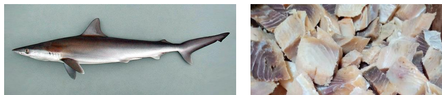
(a) (b) Gambar 2.2 Ikan Cucut (a) dan Ikan Asin Cucut (b)

Ikan asin cucut terbuat dari ikan cucut ( Rhizoprionodon acutus ) (Gambar 2.2). Pembuatan ikan cucut diawali dengan penyiangan dan pembersihan ikan dengan air mengalir. Selanjutnya ditiriskan, dan dilakukan penggaraman selama satu jam. Lalu, dilakukan pengeringan dan dilanjutkan dengan pencelupan pada larutan asap cair sekitar satu jam. Dan terakhir dilakukan pengeringan oleh sinar matahari.