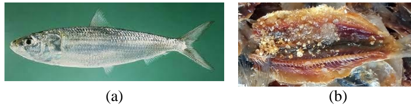
Gambar 2.4 Ikan Lemuru (a) dan Ikan Asin Kere Manis (b)