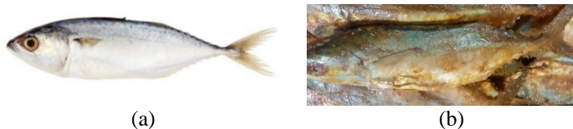
(a) (b) Gambar 2.3 Ikan Kembung (a) dan Ikan Peda Merah (b)

Ikan asin peda merah terbuat dari ikan kembung ( Rastreligger sp ) (Gambar 2.3). Cara pembuatan ikan asin peda merah diawali dengan penyiangan dan pencucian dengan air mengalir dan ditiriskan. Setelah itu dilakukan penyusunan dalam wadah secara berlapis dan ditaburi garam, dan wadah ditutup selama satu minggu. Selanjutnya wadah fermentasi dibuka, ikan dijemur 2-3 jam. Setelah kering dimasukkan ke dalam wadah bersih dan ditutup selama satu minggu, dan dijemur ulang untuk menghentikan proses fermentasi.