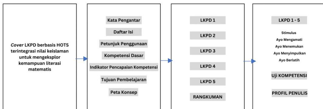
Gambar 2.4 Rancangan Model LKPD Berbasis HOTS Terintegrasi Nilai Keislaman

Produk yang dihasilkan berupa lembar kerja peserta didik (LKPD) berbasis higher order thinking skills (HOTS) terintegrasi nilai keislaman yang memuat materi Barisan dan Deret untuk peserta didik kelas XI SMA/MA. Kegiatan utama dalam LKPD yang dikembangkan yaitu: Stimulus bernuansakan keislaman, Ayo Mengamati, Ayo Menemukan, Ayo Menyimpulkan dan Ayo Berlatih dengan berbagai bentuk soal yang diawali oleh stimulus guna mengeksplor kemampuan literasi matematis. Kemudian LKPD yang dikembangkan dibuat dengan visualisasi dan konteks keislaman disertai sisipan ayat suci al-Quran, hadits, dan kata-kata Mutiara islami, diakhir bagian terdapat Uji Kompetensi dan profil pembuat LKPD. Berikut adalah gambar rancangan produk lembar kerja peserta didik (LKPD) berbasis higher order thinking skills (HOTS) terintegrasi nilai keislaman pada materi Barisan dan Deret yang akan dikembangkan