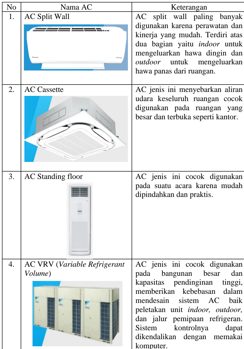
Tabel 2.3 Jenis AC gedung di Indonesia