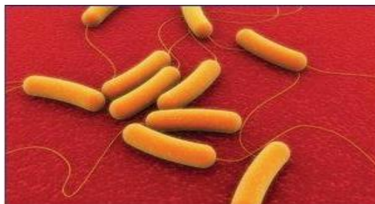
Gambar 1. Bakteri R. solanacearum

R. solanacearum bakteri basilus atau basil yang memiliki sel berbentuk batang atau silinder dapat dilihat pada Gambar 1 dan termasuk dalam kelompok bakteri gram negatif. Merupakan patogen tular tanah yang memiliki kemampuan bertahan hidup dalam tanah untuk jangka waktu yang lama tanpa keberadaan tanaman inang (Chepkoech et al. , 2013). Hal ini menunjukkan kompleksitas sifat ekobiologi R. solanacearum karena patogen ini memiliki interaksi yang erat dengan lingkungan dan tanaman inangnya, menyebabkan kendala yang sering muncul dalam pengendalian penyakit layu bakteri (Huet, 2014).