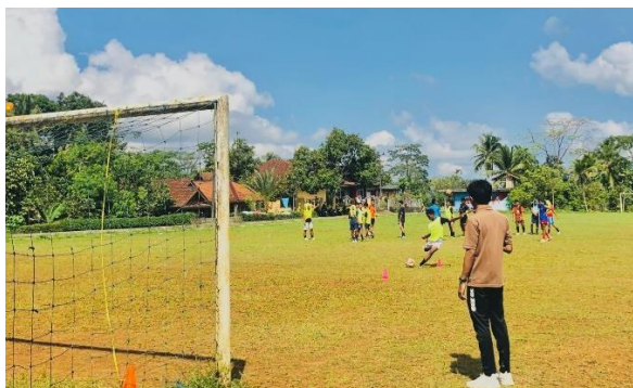
Gambar 3.3 Tes Shooting Sepakbola