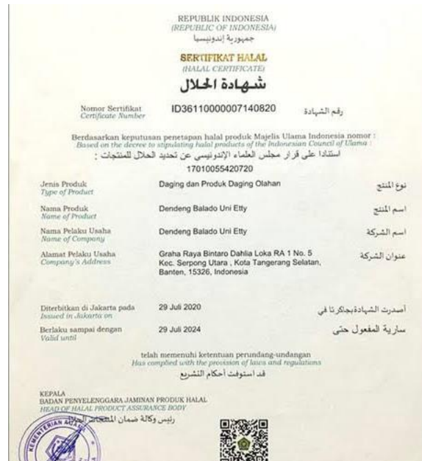
Gambar 2.1 Contoh Sertifikat Halal

pengakuan kehalalan suatu produk yang dikeluarkan oleh BPJPH berdasarkan fatwa halal tertulis yang dikeluarkan oleh MUI. 42