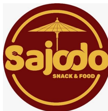
Gambar 3.1 Logo Perusahaan