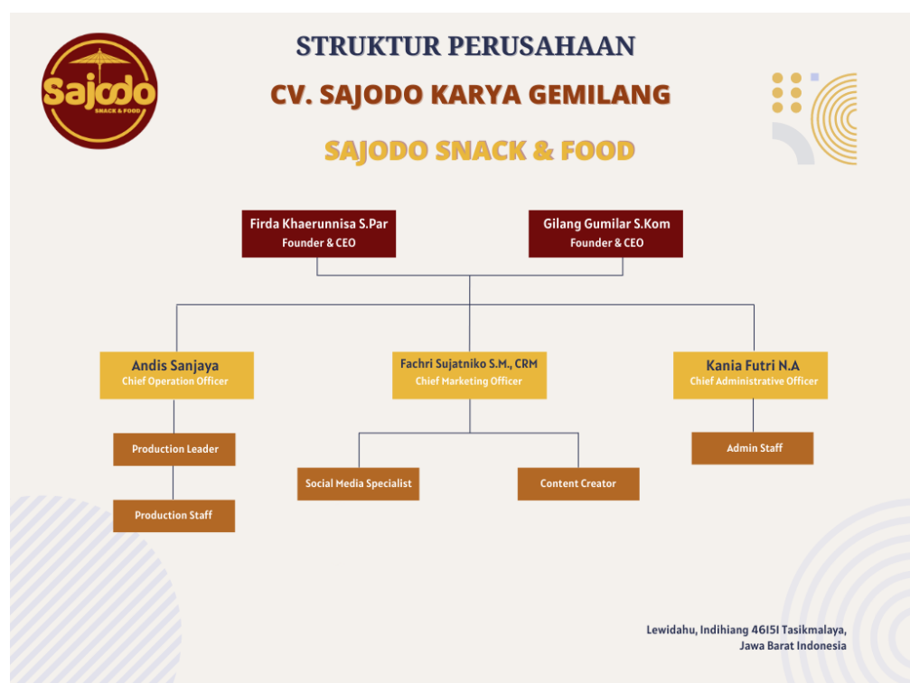
Gambar 3.2 Struktur Organisasi Perusahaan

Struktur organisasi adalah garis hierarki yang mendeskripsikan tiap bagian yang menyusun perusahaan. Setiap individu tahu sumber daya manusia yang berada pada lingkup perusahaan memiliki posisi dan fungsinya masing-masing. Berikut struktur organisasi dari CV Sajodo Karya Gemilang