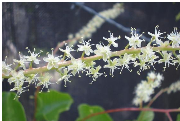
Gambar 2. 4 Bagian Bunga Tanaman Binahong ( Anredera cordifolia )

Bunga binahong (Gambar 2.4) berbentuk majemuk rimpang, tumbuh diantara ketiak daun, memiliki mahkota daun berwarna krem keputihan dengan jumlah helaian lima yang tidak berlekatan dan Panjang helai mahkota sekitar 0,5-1 cm dan mengeluarkan bau harum.