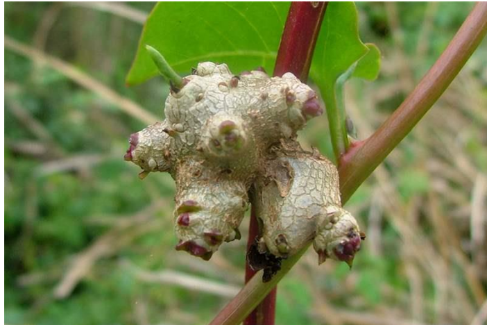
Gambar 2. 5 Bagian Akar Tanaman Binahong ( Anredera cordifolia )

Bentuk dari akar binahong (Gambar 2.5) rimpang dan berdaging lunak.