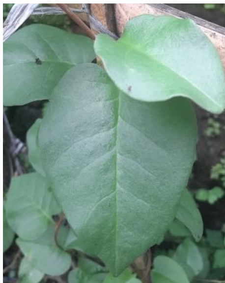
Gambar 2. 2 Bagian Daun Tanaman Binahong ( Anredera cordifolia )

Daun binahong (Gambar 2.2) berdaun tunggal, berseling, bertangkai (stem) sangat pendek, berbentuk jantung (Cordata), panjang 5-10 cm, lebar 3-7 cm, ujung runcing, pangkal berlekuk (emarginatus), tepi licin, helaian tipis, permukaan halus, dapat dimakan.