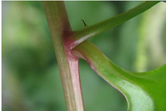
Gambar 2. 3 Bagian Batang Tanaman Binahong ( Anredera cordifolia )

Batang tanaman binahong (Gambar 2.3) lunak, bentuk silindris, saling membelit, berwarna merah, dan bagian solid dengan permukaan halus (Utami dan Desty, 2013)