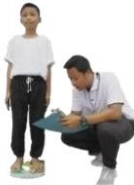
Gambar 3.2 Pengukuran Berat Badan