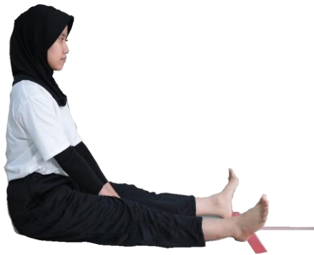
Gambar 3.4 Sikap awal V Sit Reach