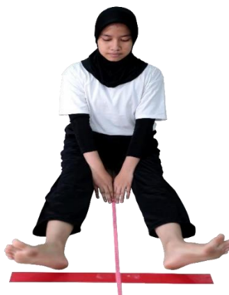
Gambar 3.5 Sikap Awal V Sit Reach