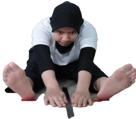
Gambar 3.3 Sikap Akhir V sit Reach