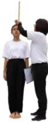
Gambar 3.1 Pengukuran tinggi badan