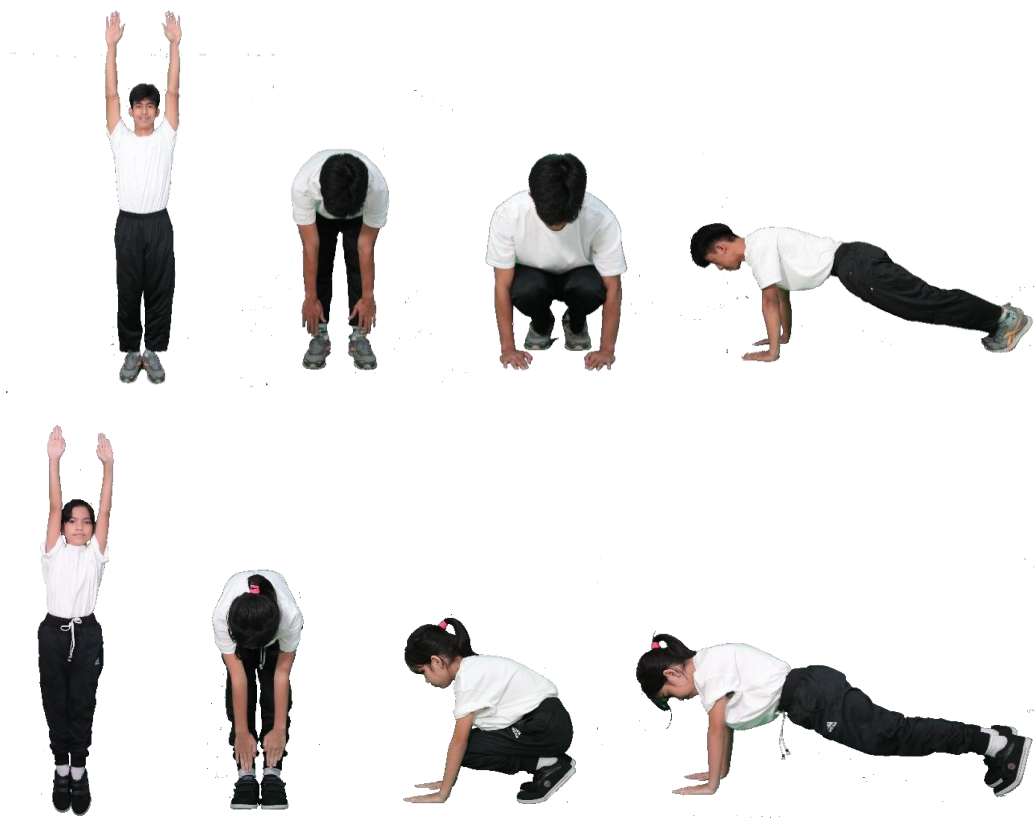
Gambar 3.7 Gerakan Squat Thrust