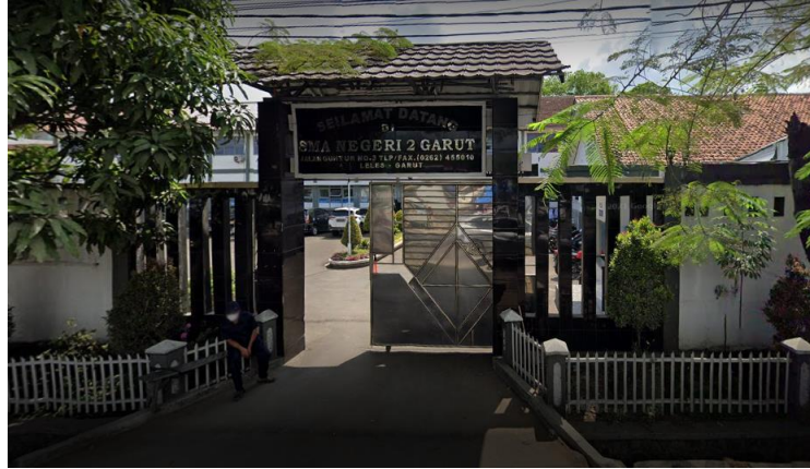
Gambar 3. 2 Foto Tampak Depan SMA Negeri 2 Garut