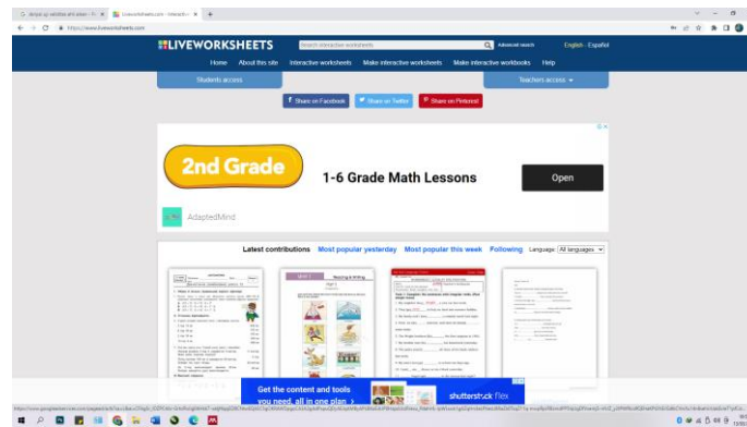
Gambar 2. 1 Tampilan Platform Liveworksheet

Gambar 2.1 merupakan tampilan halaman Liveworksheet . Pendidik bisa dengan mudah membuat LKPD dengan cara mengupload LKPD berformat jpg, pdf, png. Pendidik mengupload LKPD dengan format tersebut, pendidik membuat kolom untuk nanti akan diisi oleh siswa. Pembuatan soal di liveworksheet juga tidak hanya soal yang bisa di ketik oleh peserta didik tetapi diantaranya :